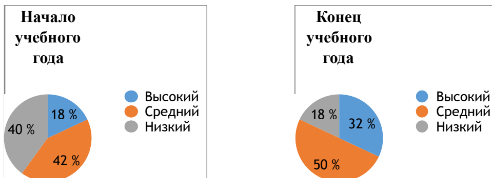
Рисунок 2. Уровни сформированности коммуникативных учебных действий у первоклассников на начало и конец учебного года.

На начало учебного года диагностика «Рукавички» показала, что сформированность коммуникативных универсальных учебных действий у 18% учащихся класса – высокого уровня, у 42% - среднего, а у 40% - низкого уровня (рис.2). На конец учебного года - результаты так же значительно улучшились.